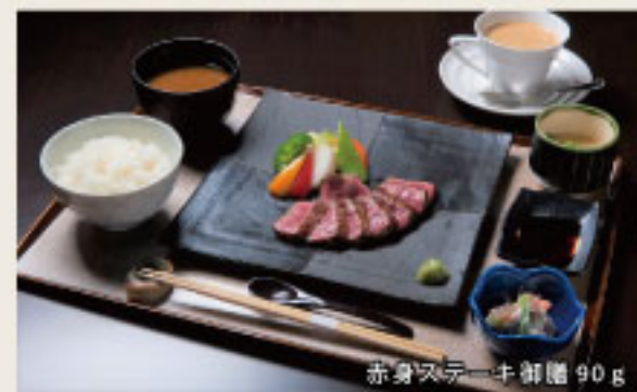
赤身ステーキ御膳90g