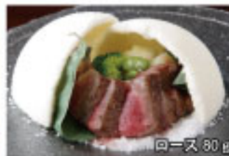
おすすめ!「かまくら焼き」